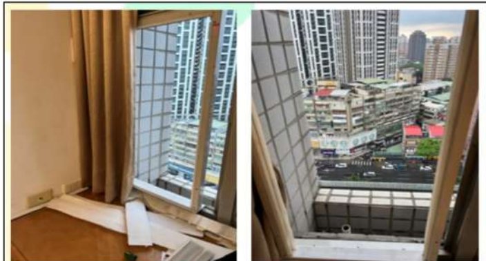
(建物冷氣機安裝事故現場情形)